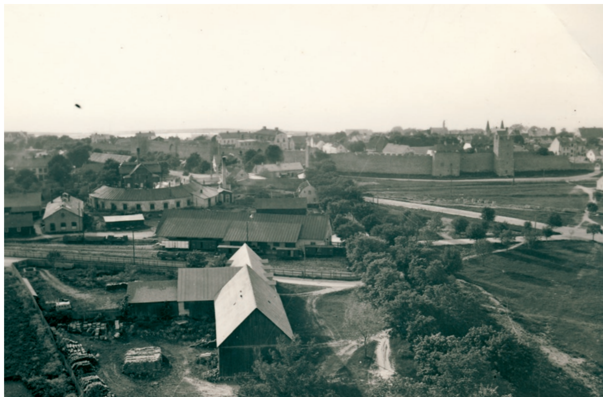
Gotlänningen, juni 1908.

Ett gytter av industrier och bostäder omedelbart utanför Söderport. Utsikt från vattentornet med bl.a. järnvägens lokstallar och mejeriet. Strax innanför muren vid Södertorg reser sig Anders Serbonis s.k. skandalhus. 1930-tal.