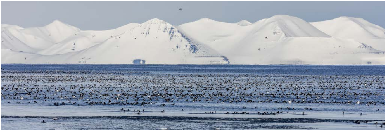
Spetsberggrisslor utanför Stellingfjellet 20 maj.