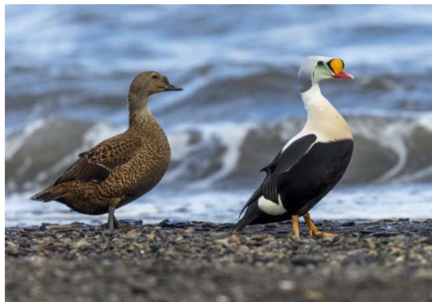
Praktejderpar, Longyearbyen 17 maj.

Ombordstigning på MS Origo vid 16-tiden. Färden inleds ut ur Isfjorden och söderut längs kusten. Natt i isen i Van Mijenfjorden utanför glaciären i Fridtjovhamna.