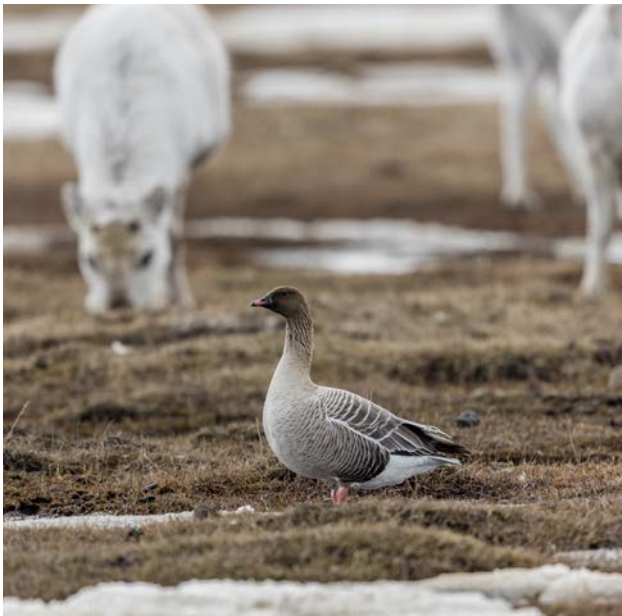
Spetsbergsgås och svalbardrennar, Adventdalen 16 maj.

De flesta deltagarna ankommer till Longyearbyen. Under eftermiddagen besöker några av oss Svalbard museum och tar en tur i de närmaste omgivningarna med bil. Välkomstmiddag på Kroa.