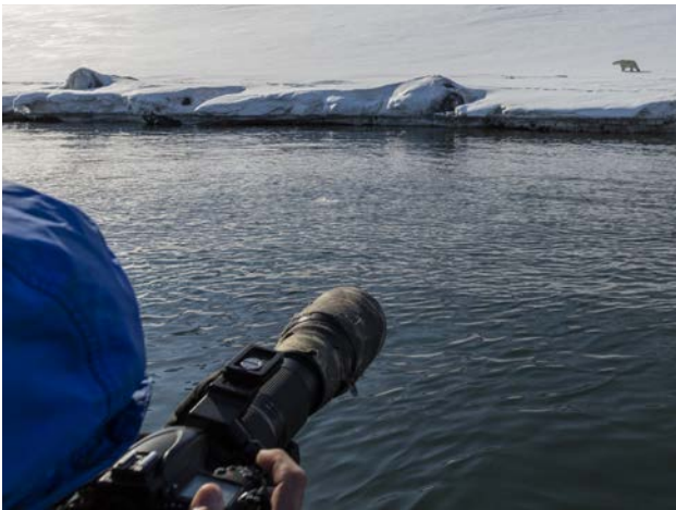
Isbjörnsfotografering, Dunérbukta 22 maj.

Mellanmål med varm dryck och snacks i zodiakerna. Strålande sol. Sedan observerar vi isbjörnarna, framför allt hanen då den vandrar längs stranden. Emellanåt tar han ett svalkande dopp i havet och rullar sig sedan i snön. Har möjlighet att se hanens vandring oavbrutet i omkring två timmar. Åter på Origo efter nästan fem timmar. Inspirerade av isbjörnen tar några av oss ett svalkande dopp i havet under en strålande sol.