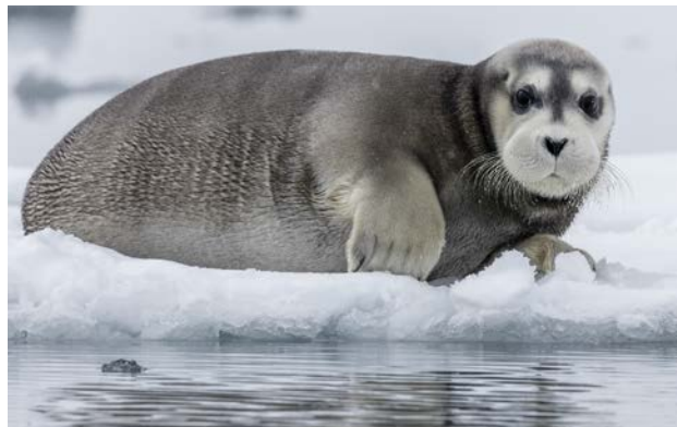
Storsälskut, Hornsund 19 maj.

Natt i isen i Brepollen. Vi följer sedan strandlinjen runt i Hornsund. Ser en ung valross i vattnet som nyfiket kommer nära zodiakerna. Ser en storsälshona med unge på isen. Besöker den polska polarforskningsstationen i Hornsund. Ser där två fjällrävar och alkekungar i oräkneligt antal flyga runt Fugelberget ovanför. Natt under gång runt Sørkapp in mot Storfjorden.