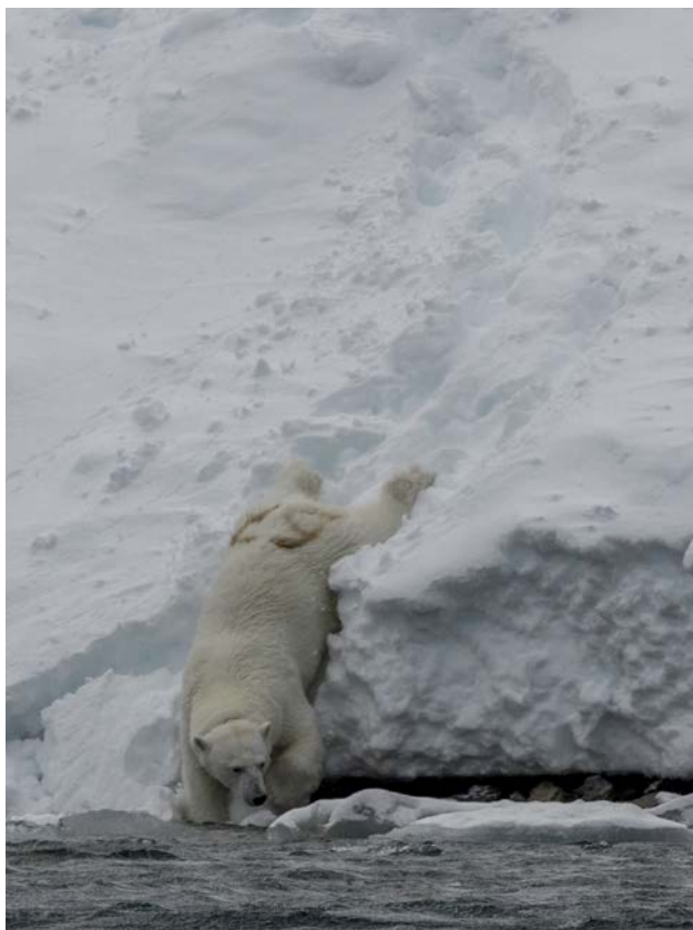
Isbjörn nr 67 åker kana, Burgerbukta 18 maj.

Färden går söderut längs västsidan av Akseløya, passerar mynningen av Van Keulenfjorden där vi ser en ännu mestadels vit fjällräv. Vi möter MS Freya som är på väg mot Longyearbyen. Fortsätter in i Hornsund. I Burgerbukta observerar vi under en knapp timme en isbjörnshona (märkt med nr 67 på baken och med sändarhalsband) som vandrar längs stranden, sedan simmar hon ut över öppet vatten.