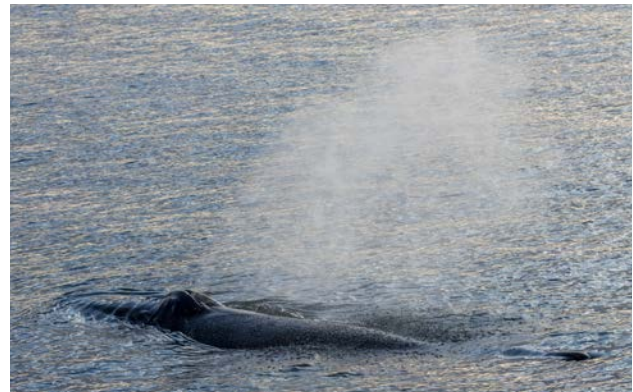
Knölval i bukten utanför Torellbreen 23 maj.