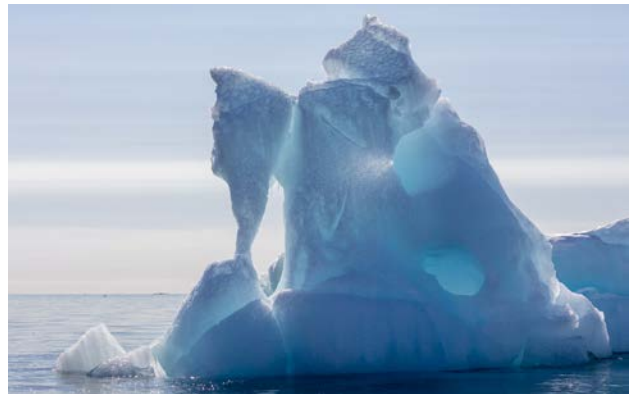
Isformationer, Dunérbukta 22 maj.