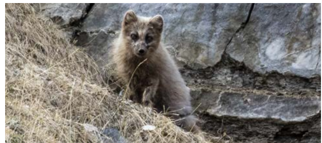
Blåräv, Skanssund 24 maj.