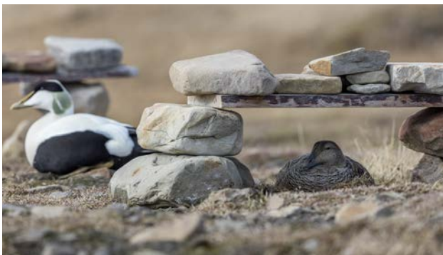
I Longyearbyen byggs skydd för ejdrarnas reden.