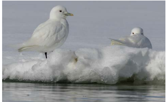
Ismås, Dunérbukta 22 maj.