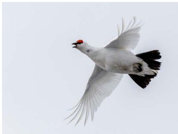
Svalbardriipa (fjällriipa), Breinosa 17 maj.